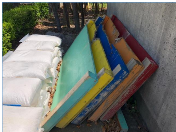
使用不可の5枚です

元シルクドゥソレイユメンバーのなわとび実演が今年1月に宮池小で行われて以来、子ども達のなわとびへの情熱は大変高まっております。一方で子ども達を使用する、なわとび練習台が8枚中、5枚が破損している状況です。子ども達が元気に楽しく、なわとびを行えるよう、学校と協力して補修をしたいと考えております。詳細は追ってご連絡致します。