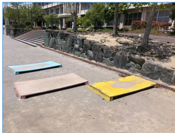
使える3枚も損傷しています・・・