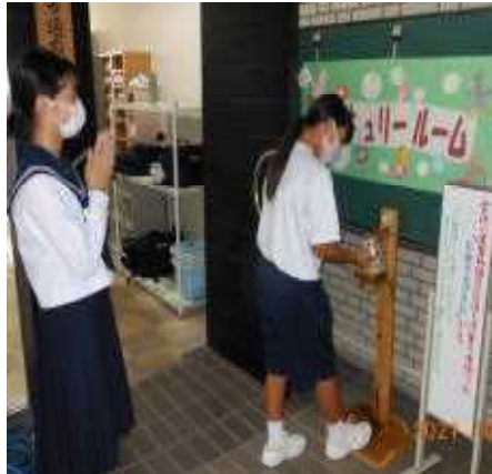
マーキュールーム