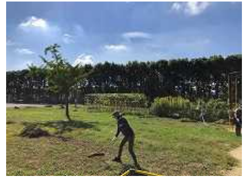
応援団の除草作業

きれいになったグラウンドで、「励まし合い、仲間を応援して喜び合う『あい』がいっぱいの運動会」になるといいですね。元気いっぱい駆け回る子どもたちの姿が、目に浮かぶようです。ご協力ありがとうございました。